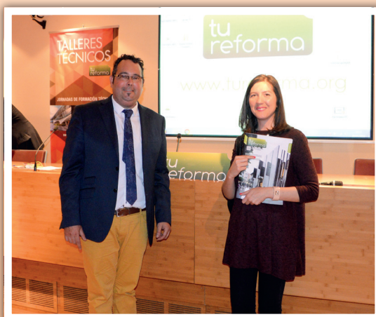
FINALISTA VIAJE A VIETNAM