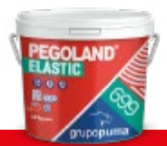
PEGOLAND® ELASTIC R2