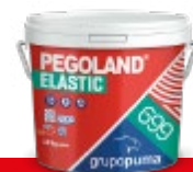
PEGOLAND® ELASTIC R2