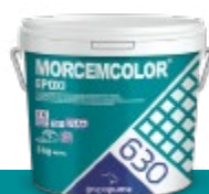
MORCEMOLOR® EPOXI RG